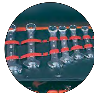
Retro del pannello appositamente realizzato per alloggiare chiavi