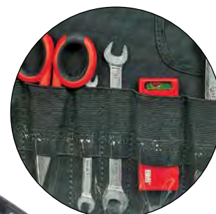
Tasche in materiale elastico