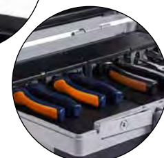
Portautensili per mantenere gli utensili in posizione