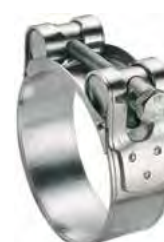
L 6583/1 - W1