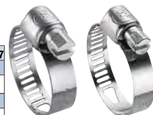
L 6578/2 - W2 L 6580/2 - W4 INOX AISI 304