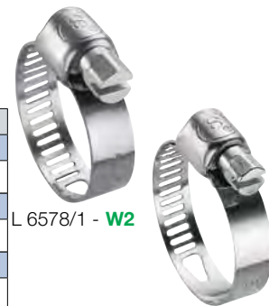
L 6578/1 - W2