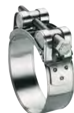
L 6583/5 - W4 INOX AISI 304