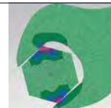
CHIAVE A FORCHETTA COMUNE: gioco sugli spigoli causa danneggiamenti