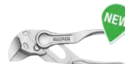
A 2882 mm 100