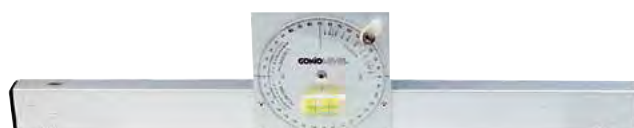
Con base magnetica

Squadra/livella regolabile → H 6 pag. 707