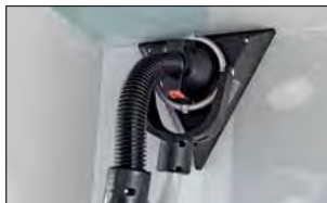
Levigatura di angoli e spigoli