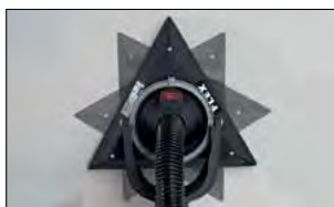
Testa triangolare girevole a 360°

Lunghezza regolabile da 1330 a 1730 mm tramite impugnatura telescopica posteriore Carboncini con arresto automatico prima del totale consumo Fornita in valigia completa di 1 testa di levigatura triangolare, 1 testa di levigatura tonda, 1 tubo di aspirazione polvere da 4 m Ø 32 mm e carta abrasiva