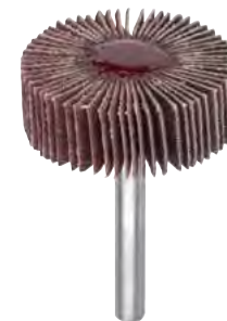
Al corindone con legante abrasivo per acciaio INOX

Al corindone per impiego frontale e laterale